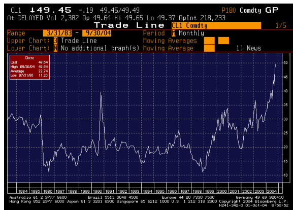
Abb. 1: Ölpreisentwicklung seit Anfang 1984.

War es im letzten Quartal noch die unerwartete Zinswende bei den kurzfristigen amerikanischen Zinsen, so hielt in diesem Quartal der Ölpreis die Märkte in Atem. Der für ein Barrel (knapp 159 Liter) US-Öl zur Lieferung im November in New York erzielte Preis von 50 Dollar markierte den höchsten Stand, der seit 21 Jahren an der New York Mercantile Exchange erreicht wurde (siehe Abb. 1).