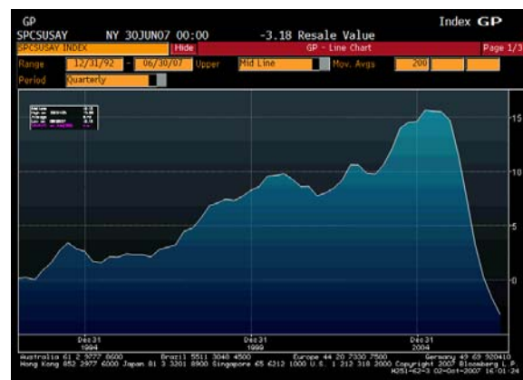
Abb. 1: Wachstumsraten des US-Immobilienmarktes seit 1993.

zu verhindern. Weiter teilte sie mit, die Verschlechterung der Kreditmarktkonditionen hätten das Potenzial, den Abschwung auf dem Immobilienmarkt zu verstärken (siehe Abbildung 1) und das Wirtschaftswachstum zu behindern.