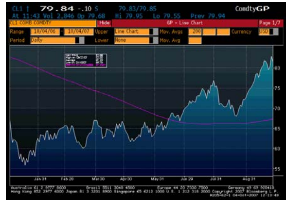
Abb. 4: Öl-Preisentwicklung seit 1 Jahr.

Ob der Boom bei Übernahmen und Fusionen weiterhin dieses hohe Niveau halten kann, bleibt abzuwarten. Die Ausweitung der Risikoaufschläge und die damit verbundenen höheren Finanzierungskosten sind zumindest nicht förderlich. Übernahmephantasie einzelner Werte waren in den ersten 6 Monaten des Jahres ein zentraler Erklärungsfaktor der Kurssteigerungen an den Börsen. Daher muss die Entwicklung in diesem Bereich im Auge behalten werden.