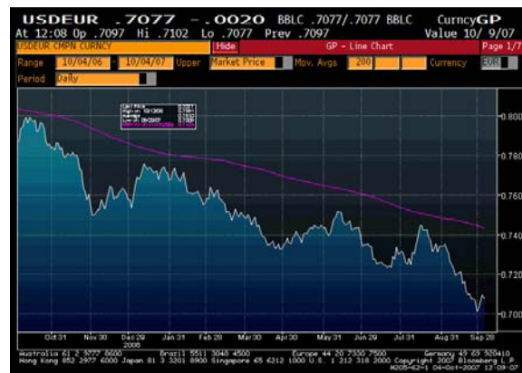
Abb. 2: Verfall des US-Dollars seit 1 Jahr.

Auf der Suche nach anhaltend starken Wachstumsimpulsen spielt Asien somit eine immer wichtigere Rolle, die es einem aktuellen Report der Asian Development Bank zufolge auch erfüllen wird. In seinem jüngsten Bericht hebt das Institut die Wachstumsprognose für Asien ex Japan von 7,6% auf 8,3% für das laufende und von 7,7% auf 8,2% für das kommende Jahr an. Vor allem der rasch wachsende inländische Konsum in China und Indien werde zum robusten Wirtschaftswachstum in der Region beitragen und könne einer schwächeren US-Konjunktur trotzen. Insgesamt sei Asien wesentlich besser vor einer Krise gefeit als noch vor zehn Jahren – ein Umstand, den die Region nicht zuletzt Währungsreserven in Höhe von 3.000 Mrd. US-Dollar verdankt.