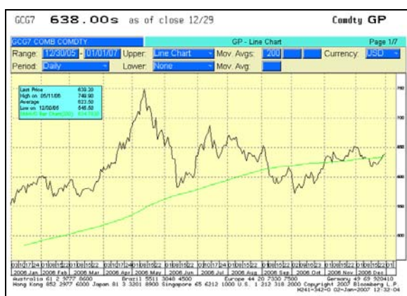
Abb. 4: Goldpreisentwicklung im Jahr 2006

Bereits im Jahr 2006 verfolgten die Marktteilnehmer die Zinsentwicklung in den USA sehr aufmerksam. Dies wird sich 2007 fortsetzen. Zum einen erhöhen die niedrigeren Renditen durch gefallene Zinsen die Attraktivität der Aktienmärkte. Zum anderen ziehen niedrigere Zinsen weniger Anlagegelder aus der Welt an, was theoretisch zu einer Schwäche des US-Dollars führt. Aus europäischer und asiatischer Sicht sind dies zwei gegenläufige Effekte. Eine erhöhte relative Attraktivität spricht für steigende Aktienkurse, ein schwacher US-Dollar belastet dagegen die Gewinne der Exportunternehmen und spricht für sinkende Kurse. Wir glauben nicht, dass der US-Dollar auf Dauer den massiven volkswirtschaftlichen Ungleichgewichten (Haushalts- und Handelsdefizit, Verschuldung der Privathaushalte etc.) standhalten kann und daher auch im Jahr 2007 an Wert verlieren wird. Allerdings wird dieser Prozess eher Schritt für Schritt erfolgen und nicht in einem Rutsch. Insofern erwarten wir, dass sich die Exportwirtschaften Europas und Asiens (v.a. Deutschland, China und Japan) darauf einstellen können und wir somit ein gutes Aktienjahr 2007 an diesen Märkten vor uns haben.