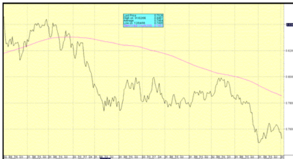
Abb. 1: Entwicklung des US-Dollar im Jahr 2006

Die Strategie für Ihr Depot im Jahr 2006 war, sich im Aktienbereich auf Europa (besonders Deutschland), teilweise Asien und auf die Edelmetall- und Rohstoffmärkte zu konzentrieren. Bis auf eine für uns enttäuschende Performance des japanischen Marktes (-5,0% in Euro) ist diese Rechnung voll aufgegangen. Vor allem die massive Untergewichtung von Amerika hat sich vor dem Hintergrund einer Dollarschwäche von -8% für europäische Investoren wie uns bezahlt gemacht (siehe Abb. 1).