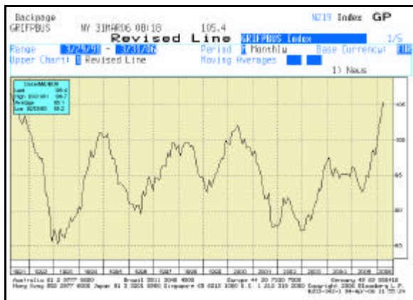
Abb. 2: IFO Geschäftsklimaindex seit 1991

Die Industrie in Deutschland und der Euro-Zone erlebt derzeit den stärksten Aufschwung seit fast sechs Jahren. Der Ifo-Geschäftsklimaindex hatte zuletzt den höchsten Stand seit dem Wiedervereinigungsboom erklommen (siehe Abb. 2).