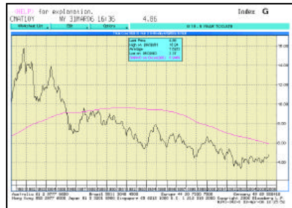
Abb. 1: 10-jährige US-Rendite seit 1980

Derartige „Ausbruchsversuche“ der langfristigen Zinsen gab es in den letzten 23 Jahren allerdings schon häufiger, jedoch waren diese bisher nie nachhaltig. Langfristig betrachtet ist der Abwärtstrend der Zinsen weiterhin intakt , was die guten Anleihenrenditen in den letzten beiden Jahrzehnten erklärt (siehe Abbildung 1).