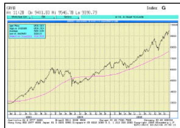
Abb. 2: Indischer Aktienmarkt im Jahr 2005

Während Indiens anhaltendes Bevölkerungswachstum, exzellent ausgebildete Arbeitskräfte und eine hohe Handelsoffenheit langfristig für eine positive Entwicklung des Landes sprechen, ist fraglich, ob die Börse in Bombay ihre Rallye 2006 unvermindert fortsetzen kann. In den letzten zweieinhalb Jahren hat sich der indische Leitindex verdreifacht (siehe Abbildung 2) und mit einem durchschnittlichen 2006er KGV von 14 erscheinen viele der Unternehmen nunmehr gut bezahlt.